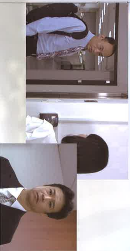
公務員廉政教材－廉政就在你身旁

以詐術為手段。所謂以詐術使人交付財物，必須被詐欺人（即被害人）因其詐術而陷於錯誤，若其所用方法不能認為詐術，亦不致使人陷於錯誤，即不構成該罪。另所謂詐術行為，並不以積極之語言、文字、肢體、舉動或兼有之綜合表態等為限，其因消極之隱瞞行為，致使被害人陷於錯誤，亦包括在內。